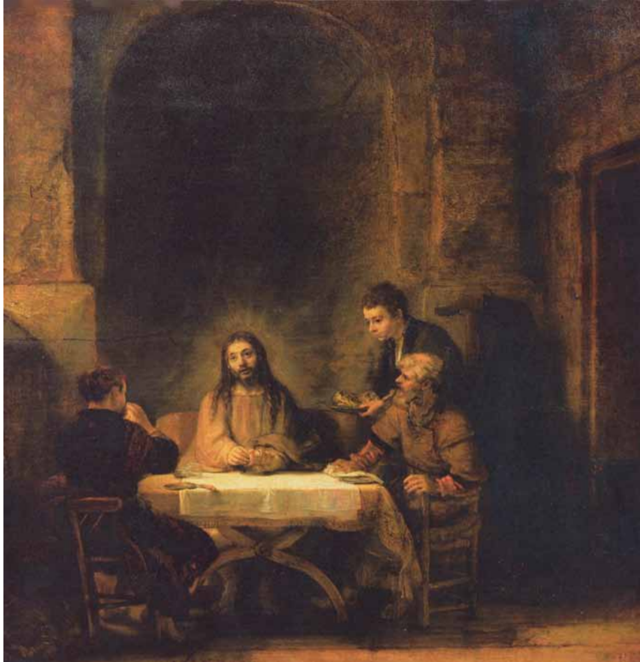
Rembrandt Harmenszoon van Rijn

Unser Leben spielt sich in einem Wechsel von Trauer und Freude, Angst und Zuversicht, Verzweiflung und Hoffnung ab. Wir leben in einer Welt, in der vieles dunkel ist, in der es viel Anlass zur Klage gibt, und in der Not und Gewalt herrscht. In der Auferstehung Jesu zeigt sich, dass